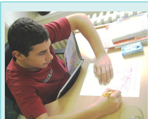
Pracovní list – odkud pocházejí jablka v obchodě?

Střední škola, základní škola a mateřská škola JISTOTA, o. p. s., Prostějov