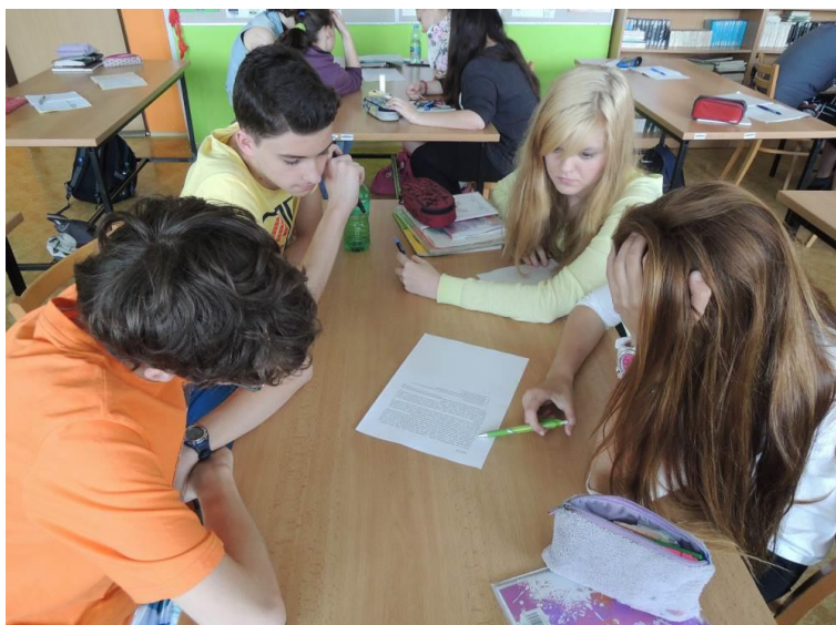
Pilotáž lekce Otokářství včera a dnes, Základní škola a mateřská škola Olomouc, Nedvědova 17