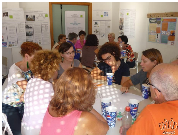
Mezinárodní konference projektu v Itálii, 6. 9. 2014, sdílení zkušeností pedagogů s tvorbou metodických materiálů