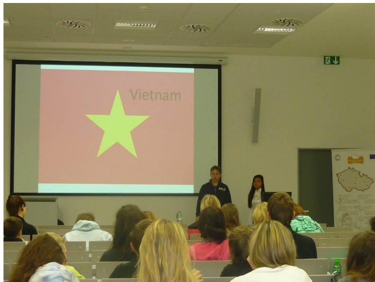
Exkurze s tématem Migrace a situace cizinců v ČR, Centrum pro integraci cizinců Zlín.

Mongolska, kteří vyprávěli o svých zkušenostech a přidali zajímavé informace o zemích svého původu. Odpoledne pak na středoškoláky a pedagogy čekala přednáška o práci integračních center a integraci cizinců v ČR a mladší žáci si vyzkoušeli hry z různých zemí světa a prohlédli si výstavu Jindřicha Štreita s příběhy cizinců žijících v ČR.