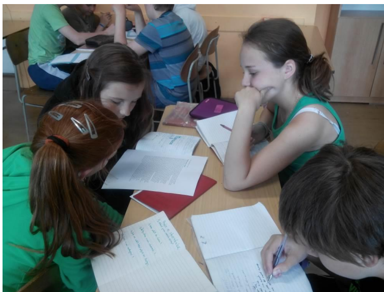
Pilotáž lekce Příběhy migrace Základní škola Svatoplukova 7, Šternberk